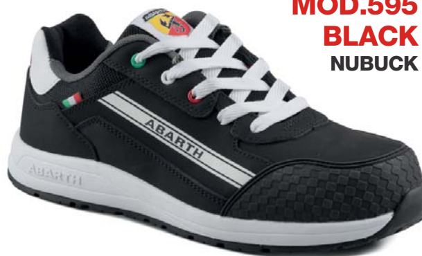
MOD.595 BLACK NUBUCK