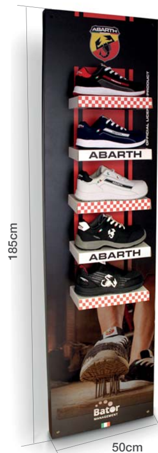
Expositor pared Abarth 5 posiciones Abarth shoes wall display 5 positions