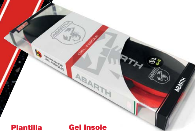
Plantilla de Gel ABARTH Performance