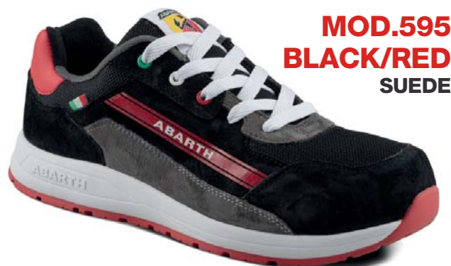
MOD.595 BLACK/RED SUEDE