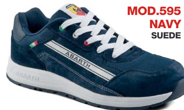
MOD.595 NAVY SUEDE