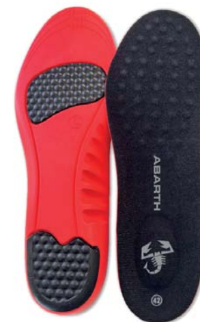
Gel Insole ABARTH +PLUS COMFORT

Tallas 36-39: Ref.ABAC002-36 Tallas 39-42: Ref.ABAC002-39 Tallas 42-45: Ref.ABAC002-42