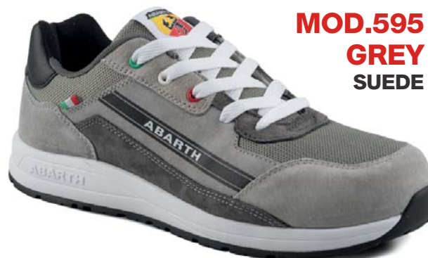
MOD.595 GREY SUEDE