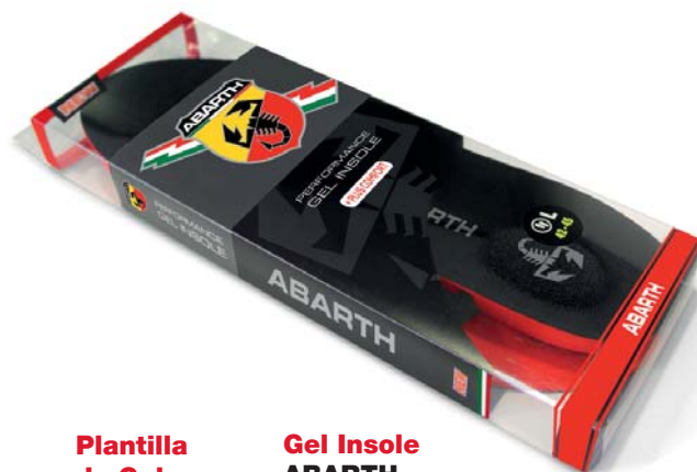
Plantilla de Gel ABARTH +PLUS COMFORT

Tallas 36-41: Ref.ABAC001-36 Tallas 42-47: Ref.ABAC001-42