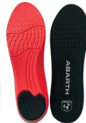
Gel Insole ABARTH Performance

Tallas 36-41: Ref.ABAC001-36 Tallas 42-47: Ref.ABAC001-42