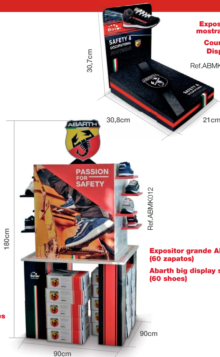
Expositor grande Abarth (60 zapatos) Abarth big display stand (60 shoes)