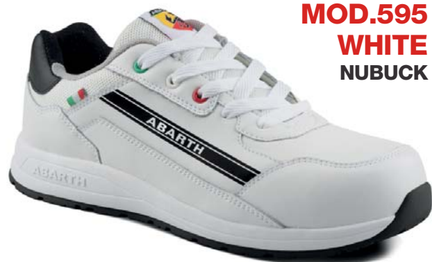
MOD.595 WHITE NUBUCK